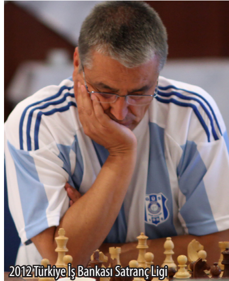
2012 Türkiye İş Bankası Satranç Ligi

Satrancı tarif ederken yeteneği, gelişimi, zekâyı vb. geliştirdiği gibi, inanimadığım basmakalıp tanımlar kullanırdım. Ancak sonradan anladım ki diğer insanlardan farklıyım ve en ufak olayı, durumu ilişkiyi ticari faaliyeti, sanatı,