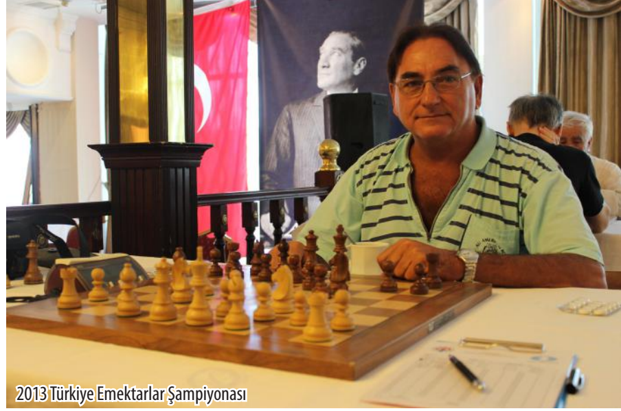
2013 Türkiye Emektarlar Şampiyonası