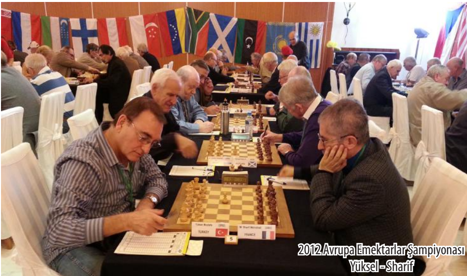
2012 Avrupa Emektarlar Şampiyonası Yüksel-Şarif

Size hobileriniz eşliğinde mutlu bir yaşam dilerken, bu güzel söyleşi için okuyucularımız adına çok teşekkür ederiz.