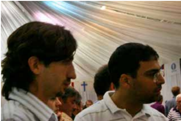
2007 Avrupa Kulüpler Kupası'nda Viswanathan Anand'la.

Dünya şampiyonlarının tamamı birbirinden değerli oyuncular. 16 büyük ismin haricinde, Morphy ve Chigorin'i oyun stilleri sebebiyle çok beğeniyorum. O dönemlerde bu kalitede oyunlar oynayabildiklerini görmek beni bugün dahi heyecanlandırıyor.