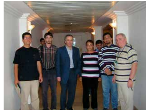
2004 Avrupa Kulüpler Kupası'nda Garry Kasparov'la, Çeşme'de.

Derginin kuruluşu sırasında aldığımız aboneliklerde '64 sayfalık 12 sayı' sözünü okurlarımıza vermiştik. Özellikle de son sayılar gecikmelerle yayımlanmış olsa da söz verdiğimiz 768 sayfanın yüzlerce sayfa ötesinde, içerikli dergilerle okurlarımızın karşısına çıkmayı başardık. Fakat yayıncılıktaki diğer faaliyetlerimizi aksattığından, bir noktada serüvenimizi noktalamamız gerekiyordu. Yıllar yıllar sonra dahi, Satrançsever'in ülkemizdeki unutulmayacak süreli yayınlar arasındaki yerini alacağına inanıyorum. Bu vesileyle dergiye yazılarıyla, çizimleriyle ve fotoğraflarıyla