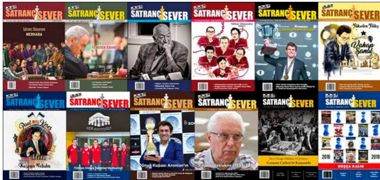
Satrançsever dergisi tüm sayılar (2016-2019).

amaçlayan bir kuruluş. Bugüne dek 45 farklı kitabı 220.000 kopyada okurlarıyla buluşturmuş bir yayınevi. Ayrıca Satrançsever dergisi ve ithal ettiğimiz İngilizcedeki binlerce kitapla bu alandaki ihtiyaca da cevap bulmayı amaçlamış ve bence tüm güçlükler karşın çok başarılı olmuş bir girişim. Arkasında yalnızca benim değil, babamın ve birçok arkadaşımın yoğun emekleri var. Çok değerli bir süreç olan kitap hazırlığı işin yalnızca bir bölümü; esas mücadele, ortaya konan eserleri okurlarıyla buluşturmakta yatıyor. Onlarca farklı şehirde kurulan yüzlerce kitap standıyla büyük bir hizmeti yerine getirmiş oluyoruz. Karşılaştığımız güçlükler kimi zaman şevkimizi kırsa da günün sonunda ağır basan hep satranç sevgimiz ve üretme isteğimiz oluyor.