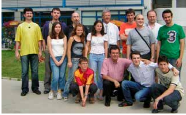
Istanbul Teknik Üniversitesi Satranç Takımı (2005 Satranç Ligi, Eczacıbaşı tesisleri, Ayazağa, İstanbul).

de çok haklı bir sualdi. Satrançla ilgili beklentilerimizi 'mutluluk' esaslı üzerine inşa edersek bu işten gerçekten keyif alan satrançseverler olabiliriz. Oyuncular azim ve hırs arasında ince ancak çok önemli bir çizgi olduğunu gözeterek kendilerini geliştirmeye çalışmalı, aileler çocuklarının yalnızca bu branşla ilgilenmekte olduklarıyla bile aslında başarılı olduklarının farkına varmalı. Eğitimci ve antrenörler de satranca bir iş gibi yaklaşmaktansa, onu gerçekten severek görevlerini en iyi şekilde yerine getirmeye çalışmalı diye düşünüyorum.