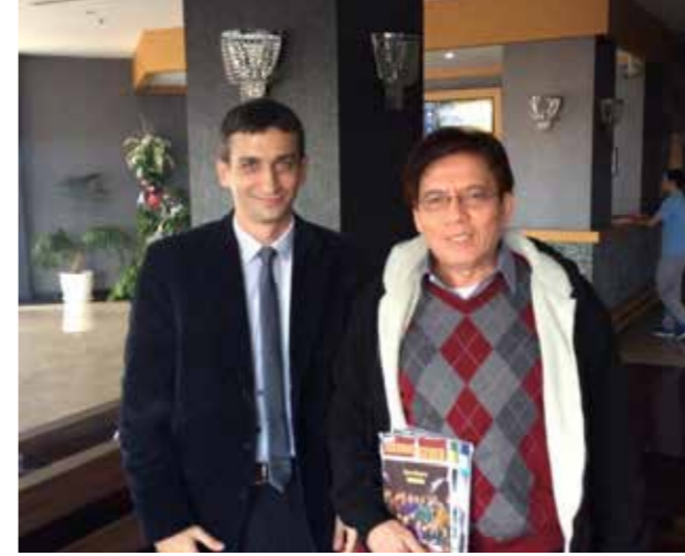
2016 yılındaki Rodostoşah Turnuvası'nda, Eugenio Torre'yle (Süleymanpaşa, Tekirdağ).

de büyük uğraşlarla, elimizden geldiğince özgün içeriklerle iyi bir dergi ortaya koymaya gayret ettik. Bu açıdan başarılı olduğumuzu düşünüyorum. Çalışmadan ticari bir beklentimiz de olmadığı için, maliyet hesabı yapmaktansa hep içeriğe odaklandık.