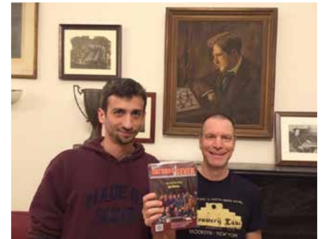
2016'da Marshall Chess Club'ta (New York, ABD).

Günümüz oyuncularının başarılarıyla kıyaslandığında ne kadar kayda değer, bilemiyorum ama 12 ve 14 yaş gruplarında Türkiye 2'liklerim, 16 yaş grubunda Türkiye şampiyonluğum var. Daha sonra Türkiye Gençler Şampiyonası Seçmelerini kazandım. 2004 yılında da Avrupa Kulüpler