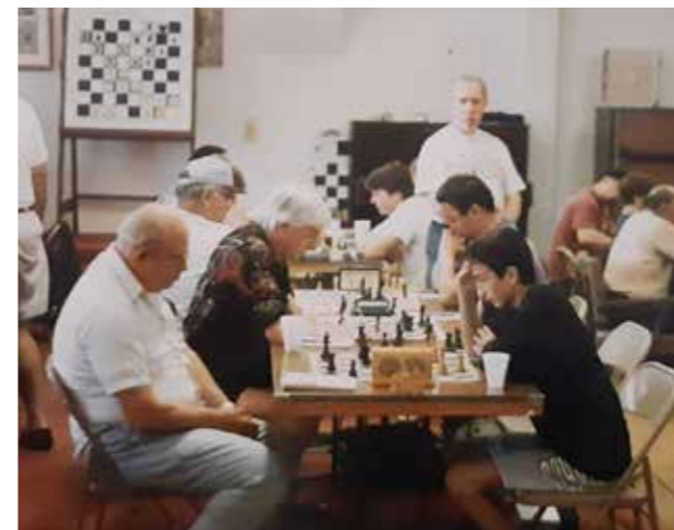
1997 yılında Seattle Chess Club'ta.

İzmir'de 90'lı yılların başlarında, özel çalışma yaygın olmadığından, grup çalışmalarına katıldım. Bahsettiğim belediye kurslarında iki yıl Cener Hoşgör ile çalıştıktan sonra, bir yaş grupları turnuvasında Enis Bilyap'la tanıştım. 9-14 yaşları arasında kendisinin kurslarına katıldım. Sonra 15 aylık bir Amerika maceram da oldu; dil eği-