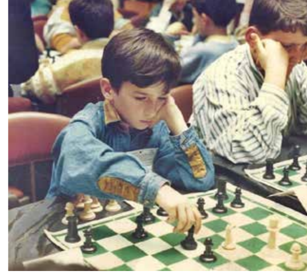
Güzelyalı Rotary Kulübü Satranç Turnuvası'nda. (İzmir, 1992)

Uluslararası Hakem ve Antrenör fyakademi@gmail.com