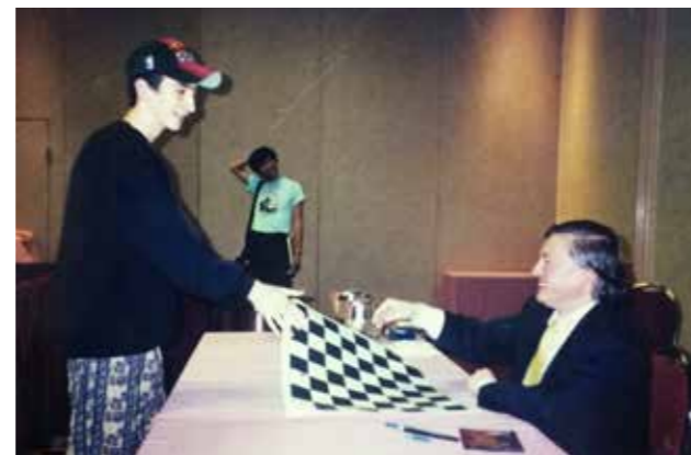
1998 yılındaki Ulusal Açık Turnuvası'nda, 12. Dünya Şampiyonu Anatoly Karpov'la (Las Vegas, ABD).

Ülkemizde hatırı sayılır kitlelerce oynandığı düşünülen satrançta bağımsız bir süreli yayının olmayışı (Mavikale'yi Türkiye Satranç Federasyonunun süreli yayını olması nedeniyle ayrı tutuyorum.) kabullenemediğim bir konuydu. 2016 yılında, çalışmakta olduğum matbaanın teşviki sonrasında, konuyu satranççı arkadaşlarımla paylaştım ve hemen hepsi en ufak bir karşılık beklemezsizin bana destek olmak istediler. Satrançsever hepimiz için bir hayalin gerçekleşmesi: Okumak istediğimiz nitelikte bir dergi nihayet kendi dilimizde yayımlanacaktı. Gerçekten