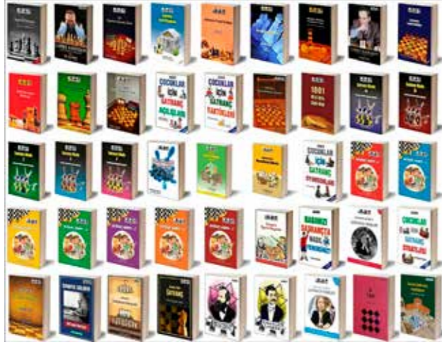
Analiz Yayıncılık tüm kitaplar.