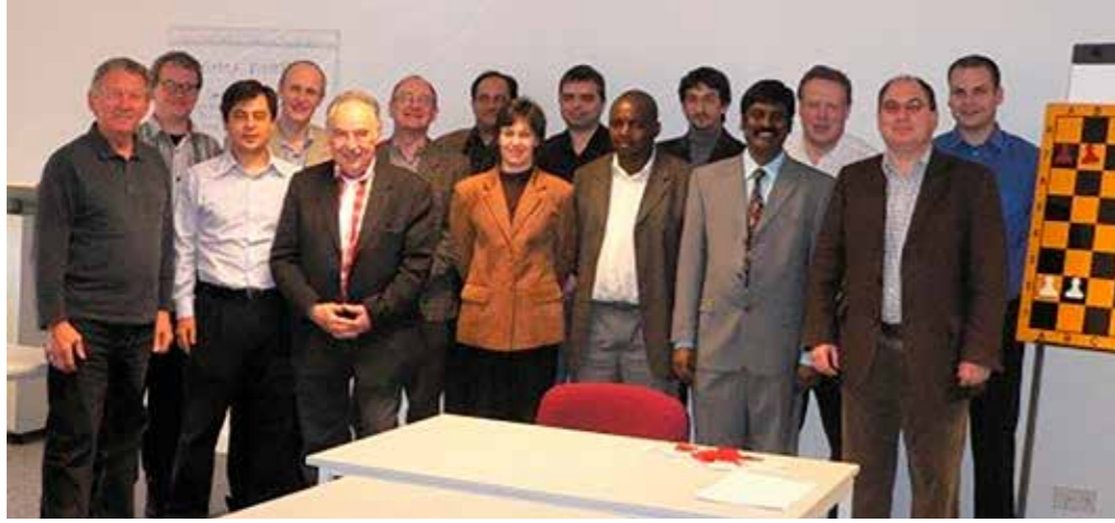
2005 yılı Antrenörlük Semineri (Berlin, Almanya).

Kupası'nda yedek masalar 2'liği madalyam var. 2008'de Türkiye Birinciliği Finallerinde oynadım. 2017 Türkiye Kulüpler Şampiyonasında masa birinciliğim bulunuyor.